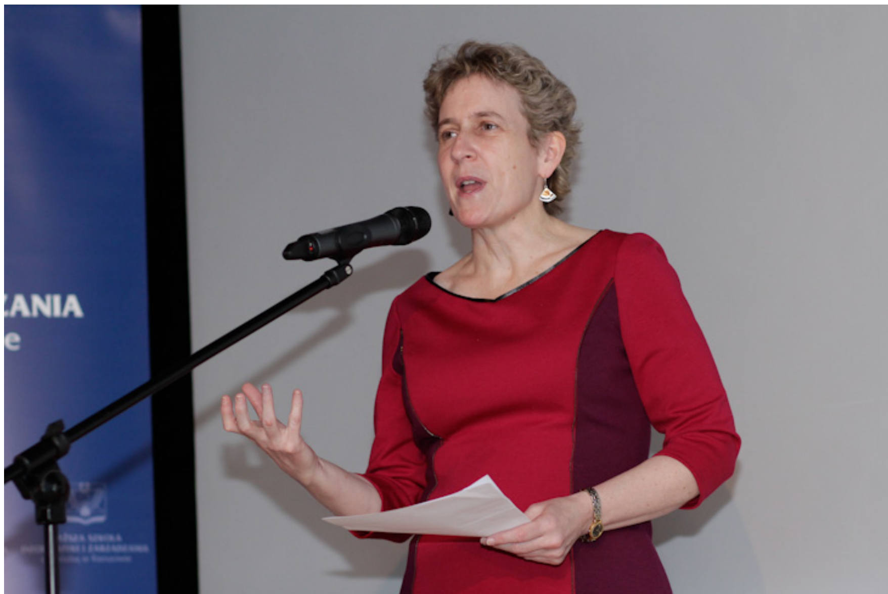
Ellen Germain, Konsul Generalna USA

W konferencji, zorganizowanej przez WSIiZ 10 grudnia, wzięła udział Ellen Germain, Konsul Generalna USA, która żywo interesuje się start-up’ami w Polsce i widzi w nich dużą szansę na zacieśnienie współpracy gospodarczej między Polską a USA. W wystąpieniu Konsul Germain w wystąpieniu „Innowacje z doliny Krzemowej do Doliny Lotniczej” zaprezentowała działania konsulatu wspierające innowacyjność i przedsiębiorczość.