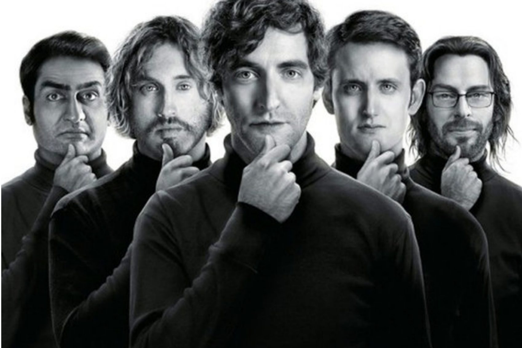
Serial "Dolina Krzemowa" opowiada historię młodych informatyków. • Fot. HBO

„Dolina Krzemowa” – ta nazwa od wielu lat brzmi mitycznie. To tam rodzą się pomysły, które mają zrewolucjonizować świat pod względem technologii. To także miejsce wielu (nie)spełnionych marzeń. Na antenie HBO możemy oglądać serial, który przenosi nas w tamte realia. Dlatego nieco przy okazji, my także Was tam przeniesiemy. Poznajcie 6 rzeczy, których mogliście nie wiedzieć o Dolinie Krzemowej.